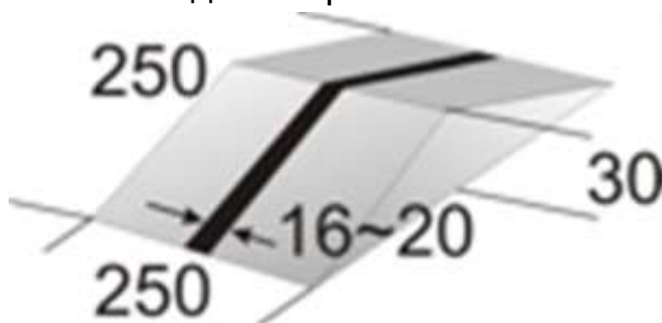
Горка для соревнования "Счетчик-траектория"